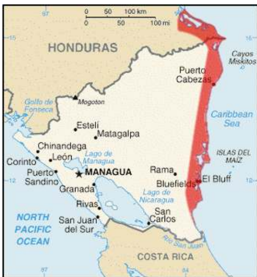
Zona roja: Meskitos

Por un historiador de la zona sabemos que Juigalpa había sido fundado en 1668 y que en 1752 era un pueblo próspero, compuesto por 34 ranchos y habitado por un millar de personas, que cuidaban de 83 haciendas de ganado y gran número de labranzas. Tenía una Iglesia de tres naves y sacristía, aunque sin torre, sobre horcones con paredes de adobe. No es, pues, de extrañar que su relativa riqueza atrajese a las vecinas tribus de Indios Meskitos y que éstos, capitaneados por su Cacique Briton, la asaltasen y saqueasen en 1782.