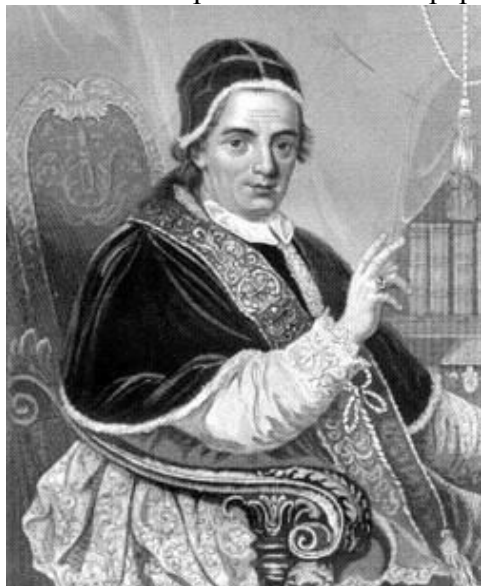
Clemente XIV, O.F.M. Conv.

“Los anuncios funestos y trágicos de la labradorcita de Valentano, todas estas novedades juntas tienen a todos los enemigos y perseguidores de la Compañía de Jesús en Roma inquietos, atónitos, confusos y asombrados y, por más que afecten intrepidez y grandeza de ánimo, llenos de susto y consternación. Y el mismo Clemente XIV se muestra muy cuidadoso, caído y abatido, y advierten de Roma que va perdiendo fuerzas y carnes, y disponiéndose sin entenderlo y a pesar suyo a verificar en su persona la funesta predicción de la contadina , pues, aunque en secreto y en voz baja, no deja de decirse que él mismo es cuya muerte se halla profetizada en los papeles que han cogido”.